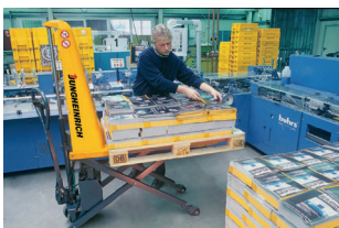
AMX10e (映像のみ) Germany