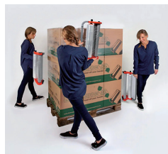
New XT Orange Holland