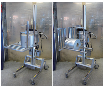
Pronomic ステンレスモジュール