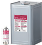
フレクソ用薬品 プリントツールシリーズ