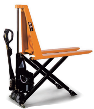
New ACX10e China