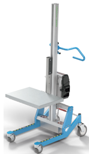
New Pronomic Lift&Drive PRX Sweden