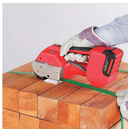
ワンタッチレバー