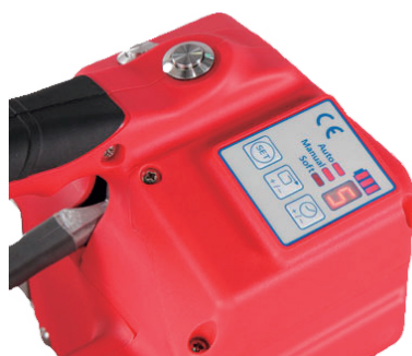
ワンタッチボタン