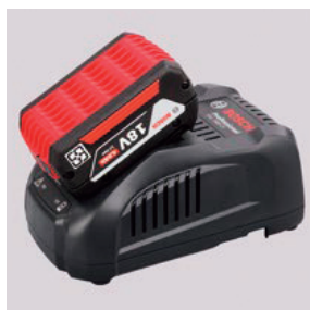
リチウムイオンバッテリー